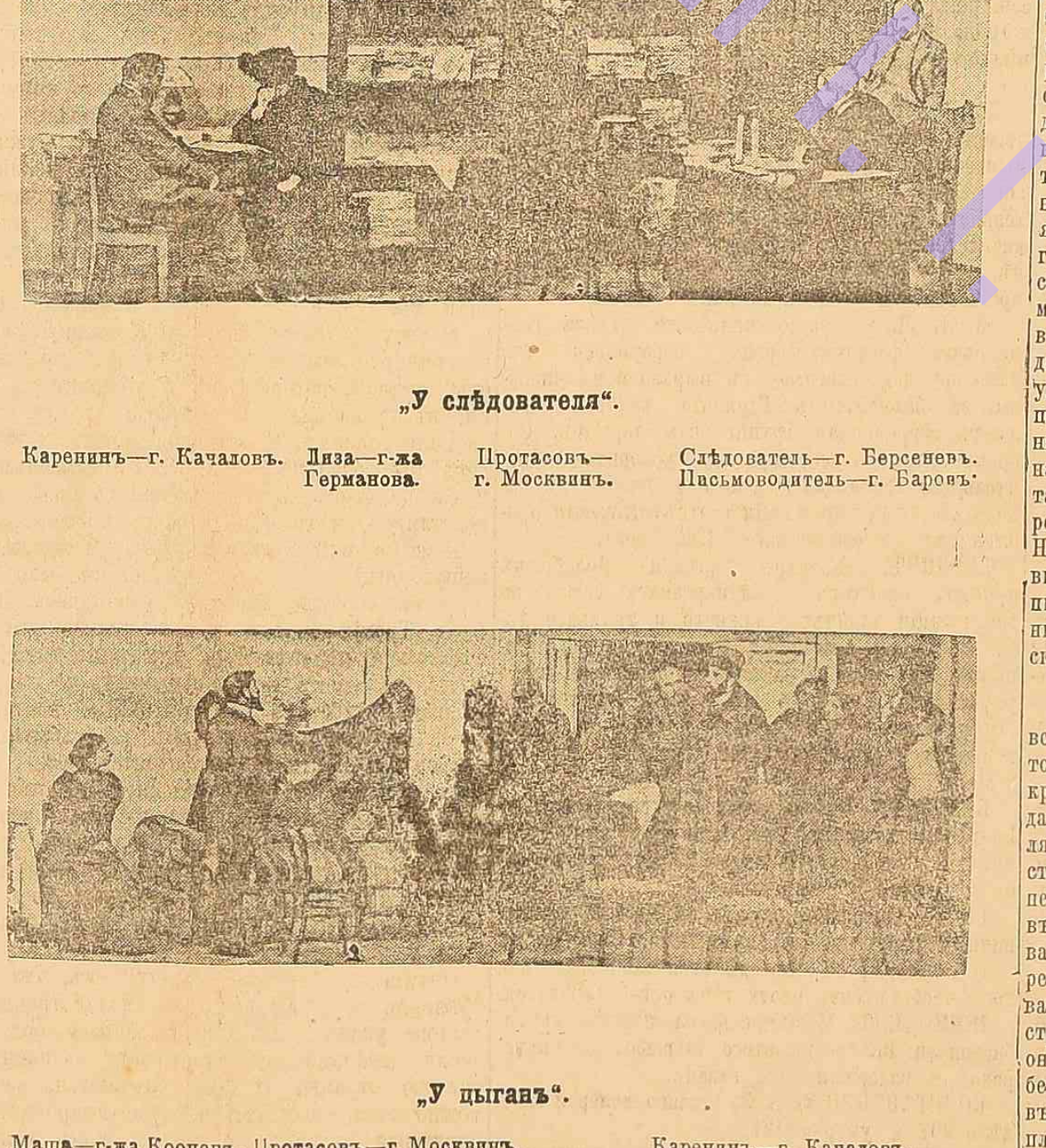
Каренин — г. Казаков. Протоазов — г. Москатов. Сафонов — г. Березнев. Пашков — г. Барков.