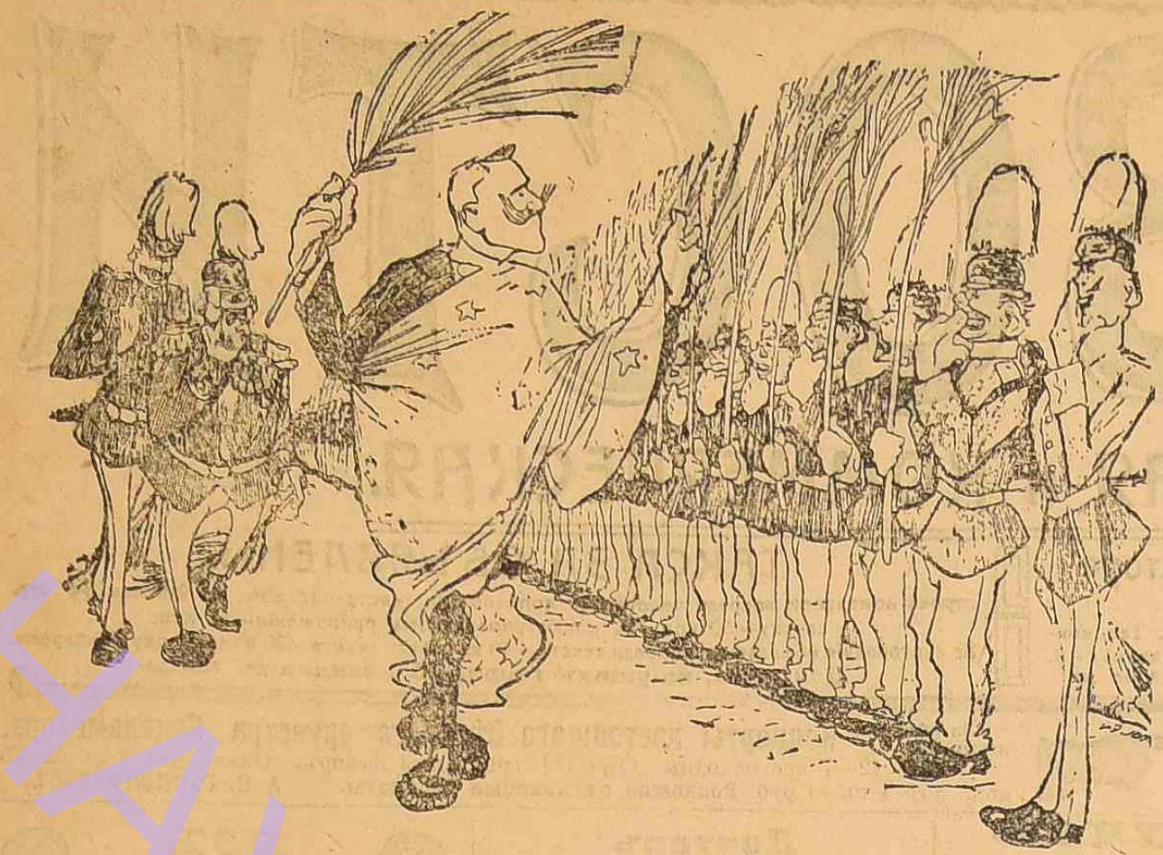
Вильгельм II. — Турция ждет нашей помощи, но в войну все наши солдаты состоят из немцев...