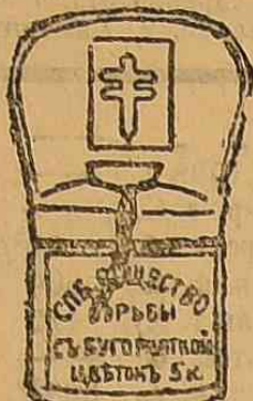
Журистка для сбора платы за цветы.