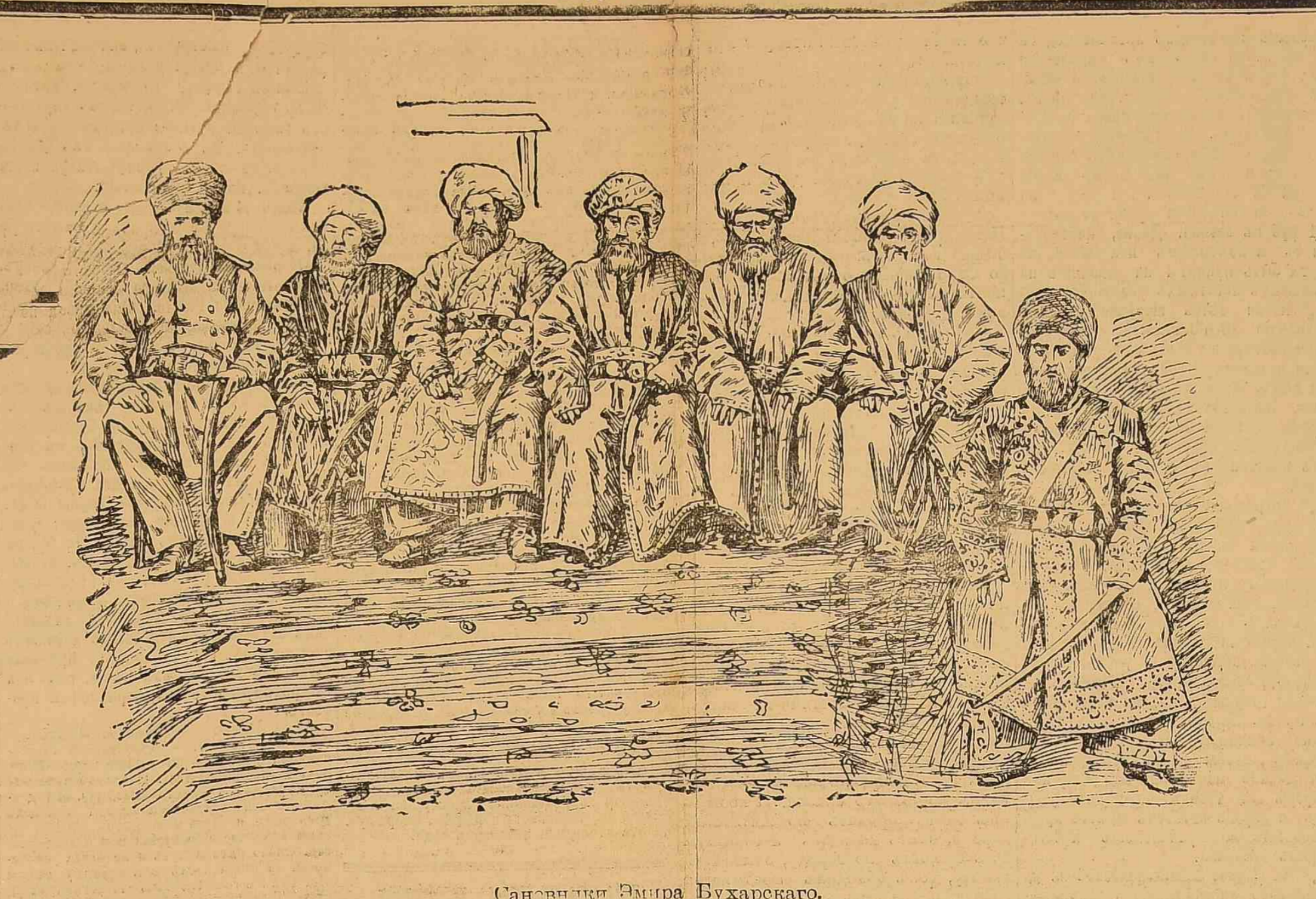
Савоничи Эмира Бухарскаго.