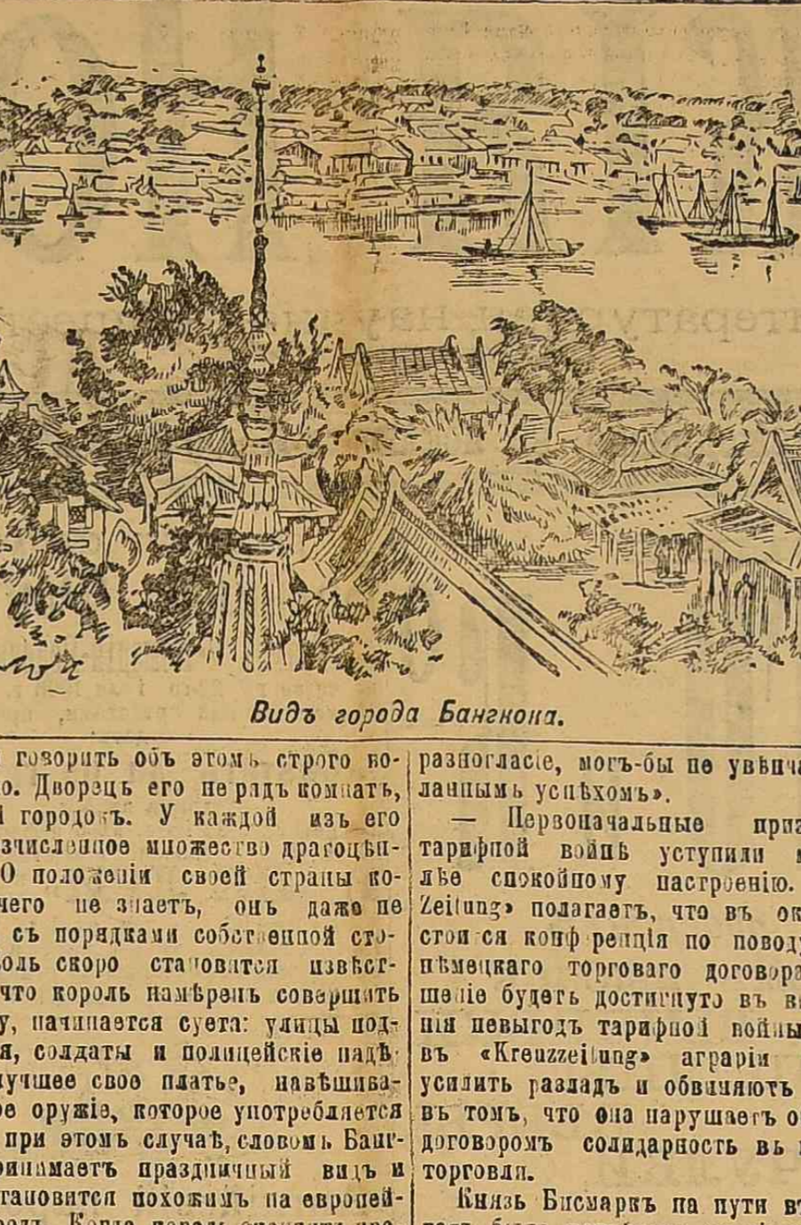
Видъ города Баненки.