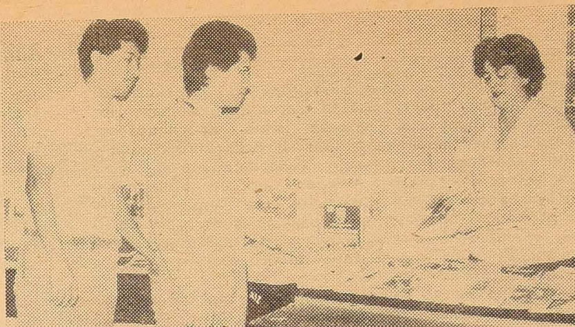
В помещении деканата по работе с иностранными учащимися создана ленинская комната, где можно ознакомиться с основными этапами жизни и деятельности вождя Октябрьской революции.