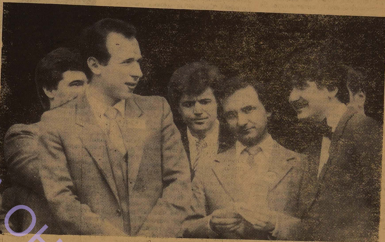
«Еще все вместе...»