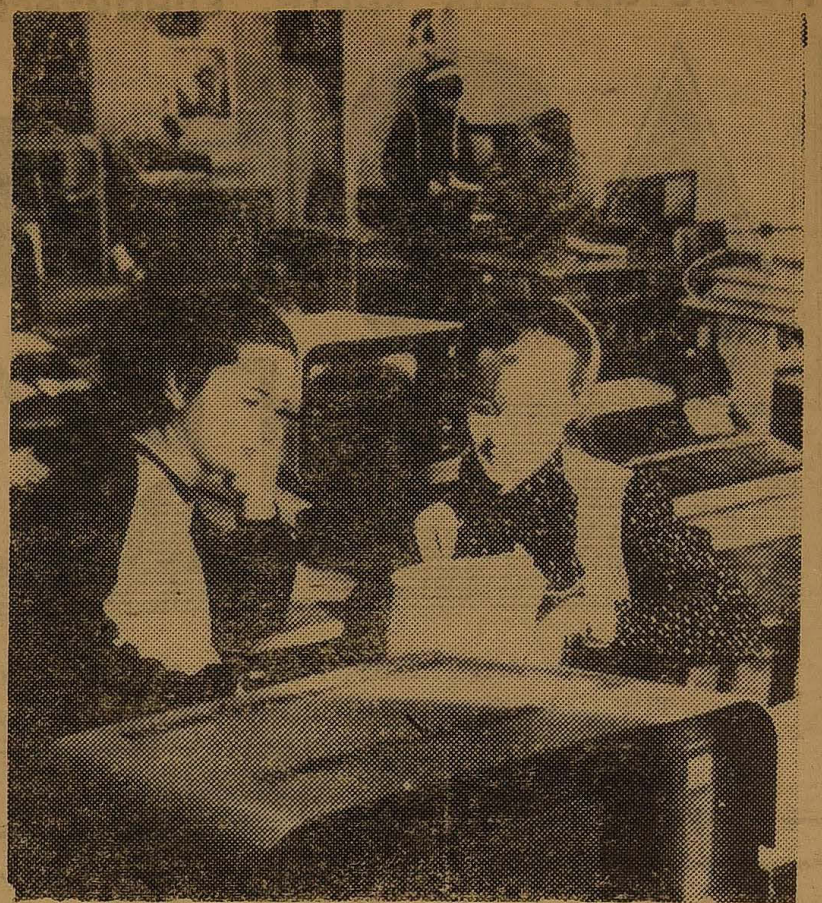
Останнім часом стають все більш помітними зусилля у справі комп'ютеризації учебного процесу в університеті.

На першому засіданні партбюро факультету РГФ нового складу секретарем обраний М. З. Яцій.