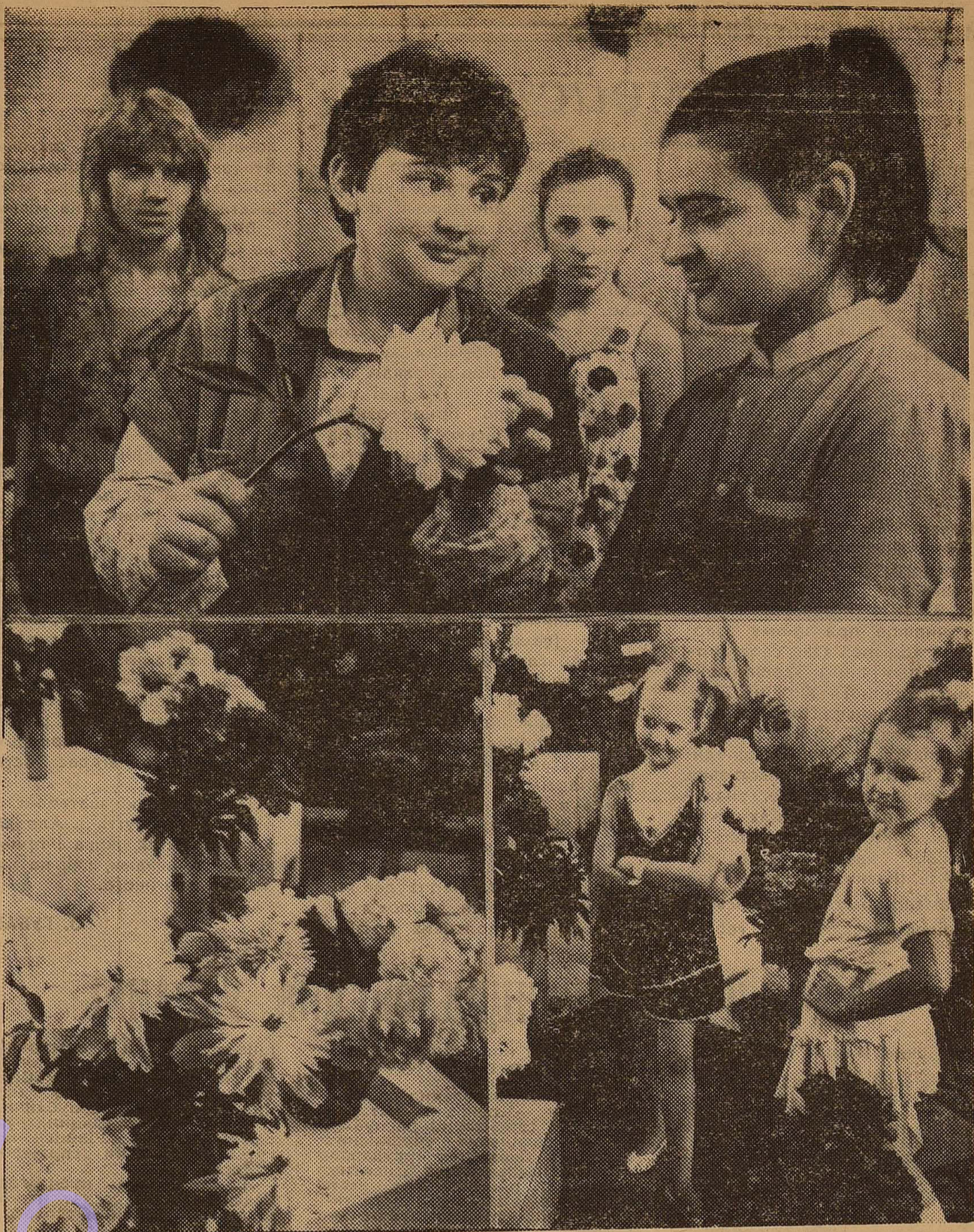
Стали уже традиционными выставки цветов, которые ежегодно проводит ботанический сад ОГУ.

Ответ: Во-первых, китайские студенты настойчиво требуют полной реформы общественной жизни в нашей стране. Они требуют большей демократизации в управлении университетом. Они добиваются права вести на равных диалог с руководством университета — ректо-