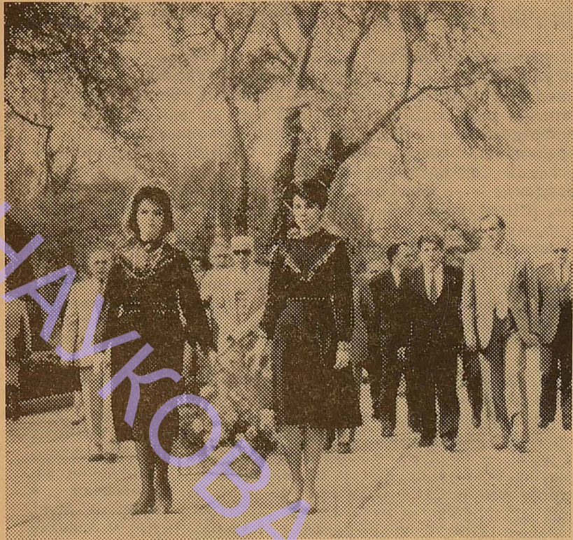
НА ЗНИМКУ: учасники Міжнародної конференції істориків несуть квіти на братську могилу загиблих революціонерів.