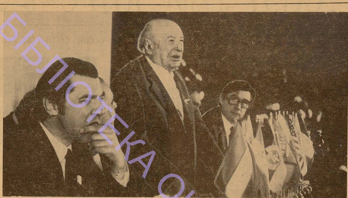
Академік І. І. Мінц відкриває міжнародну конференцію істориків в Одесі. (Читайте 3—4 стор.)

Успіх всього, що нам належить здійснити, залежить від нашої свідомості, нашої політичної культури.