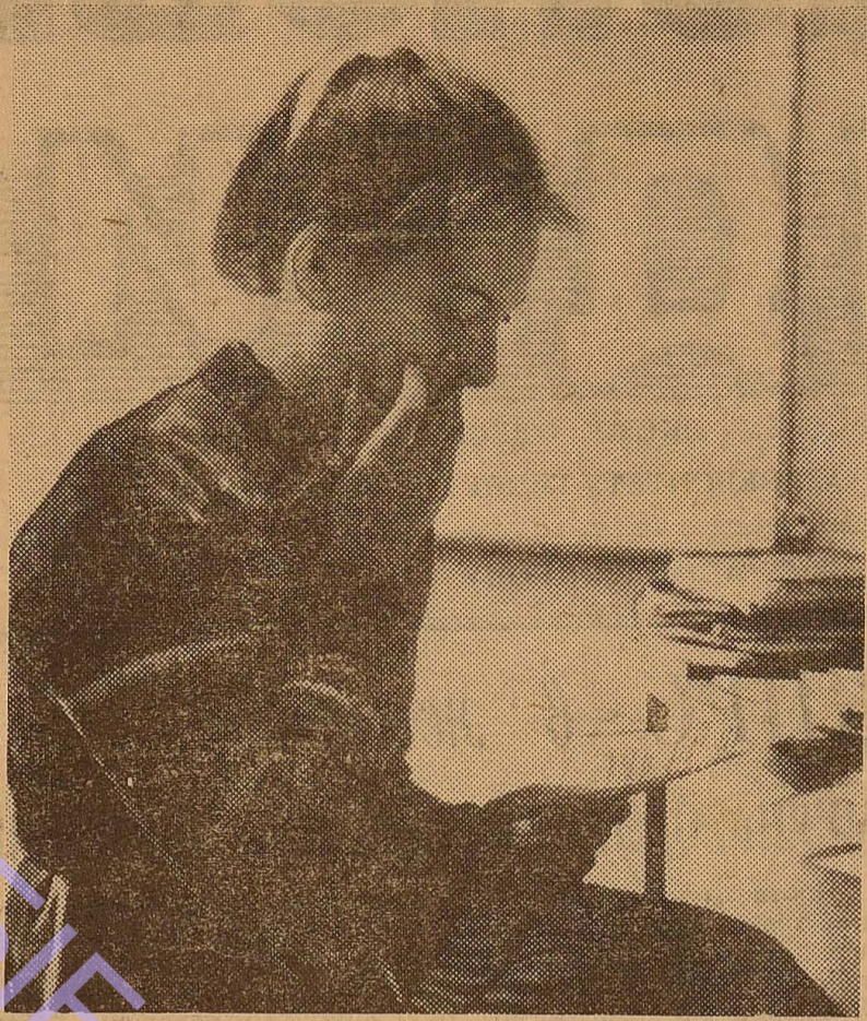
Незабаром сесія. Не можна гаяти жодної хвилини.