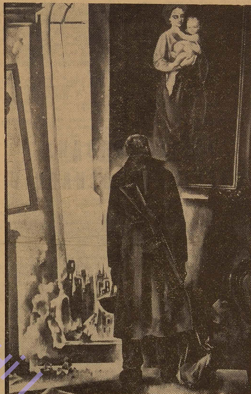
Картина художника А. Малинки «В ім'я життя».

— Завтрашній день, майбутнє повинні бути якнайкращими. Та це не здійсниться саме собою. Основне, на мій погляд, глибоке осмислення кожним — комуністом, комсомольцем, безпартійним — необхідності процесу перебудови. Треба, щоб кожен бачив те негатив-