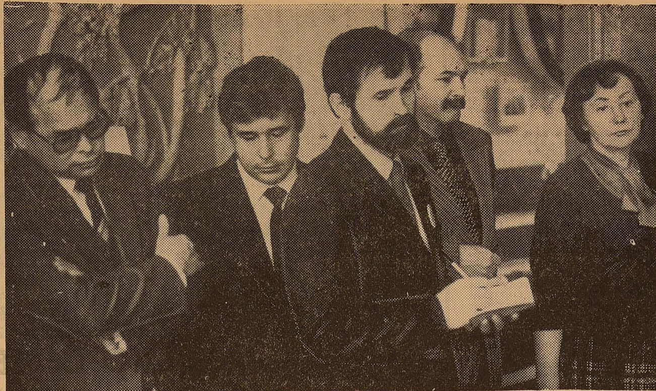
Писатели в Одесском литературном музее.