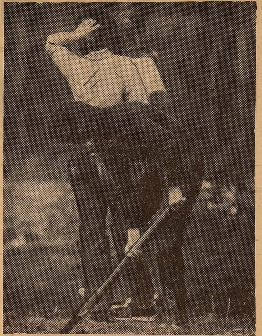
Студенти біофаку на суботнику?