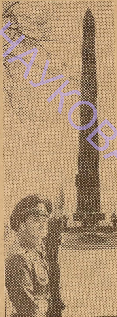
Партия, народ оказывают высокое доверие защитникам Родины. Оно и обязывает, и