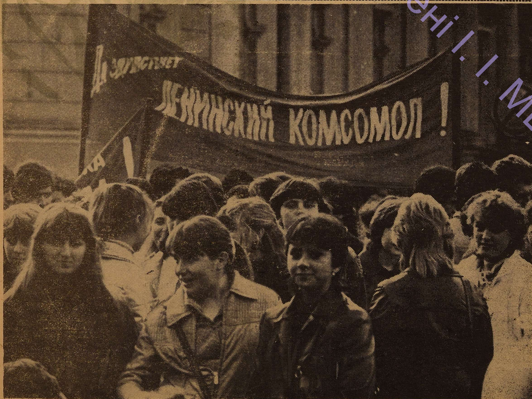
Комсомольці університету — учасники святкової демонстрації.