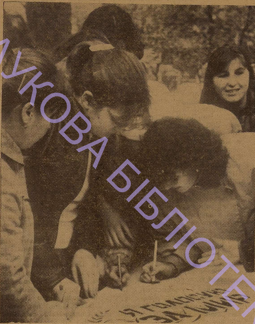
На торжественном митинге комсомольцев и молодежи Центрального района Г. Одессы, посвященном Дню рождения комсомола, студенты Одесского госуниверситета подписывают обращение «Я голосую за мир».