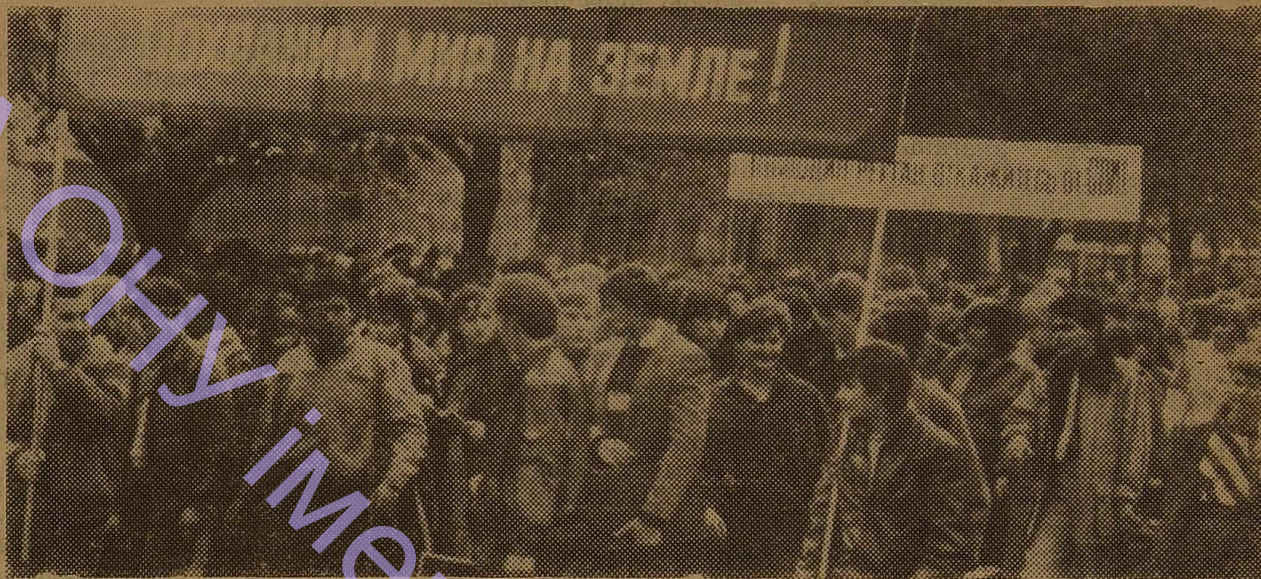
СТУДЕНТИ ОДЕСЬКОГО ДЕРЖУНІВЕРСИТЕТУ НА АНТИВОЄННОМУ МІТИНГУ.

ПРИ ВСЬОМУ ДРАМАТИЗМІ — І ХОДУ ПЕРЕГОВОРІВ, І ЇХ ПІДСУМКІВ — ЗУСТРІЧ У РЕЙК'ЯВІКУ, МОЖЛИВО ВПЕРШЕ ЗА БАГАТО ДЕСЯТИРІЧ, ТАК ДАЛЕКО ПРОСУНУЛА НАС У ПОШУКАХ ШЛЯХІВ ДО ЯДЕРНОГО РОЗЗБРОЄННЯ. Я І ЗАРАЗ ВВАЖАЮ: В РЕЗУЛЬТАТІ ЗУСТРІЧІ МИ ПІДНЯЛИСЯ НА ВИЩІЙ ШАБЕЛЬ НЕ ТІЛЬКИ В АНАЛІЗІ СИТУАЦІЇ, А Й У ВИЗНАЧЕННІ ЦІЛЕЙ І РАМОК МОЖЛИВИХ ДОМОВЛЕНОСТЕЙ ЩОДО ЯДЕРНОГО РОЗЗБРОЄННЯ. (Із виступу Генерального секретаря ЦК КПРС М. С. Горбачова по Радянському телебаченню 22 жовтня 1986 р.).