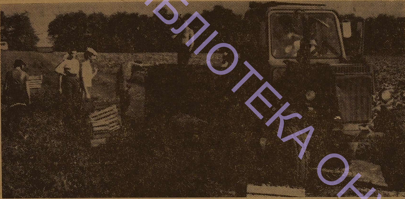
Останнє тепло, останні помідори... Успішно закінчили осінні роботи на радгоспному полі студенти хімічного факультету. Замість 1005 тонн по плану 1051 тону овочів при високій якості робіт.