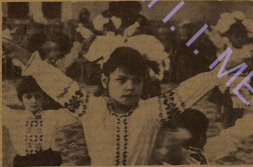
ИМ НУЖЕН МИР.