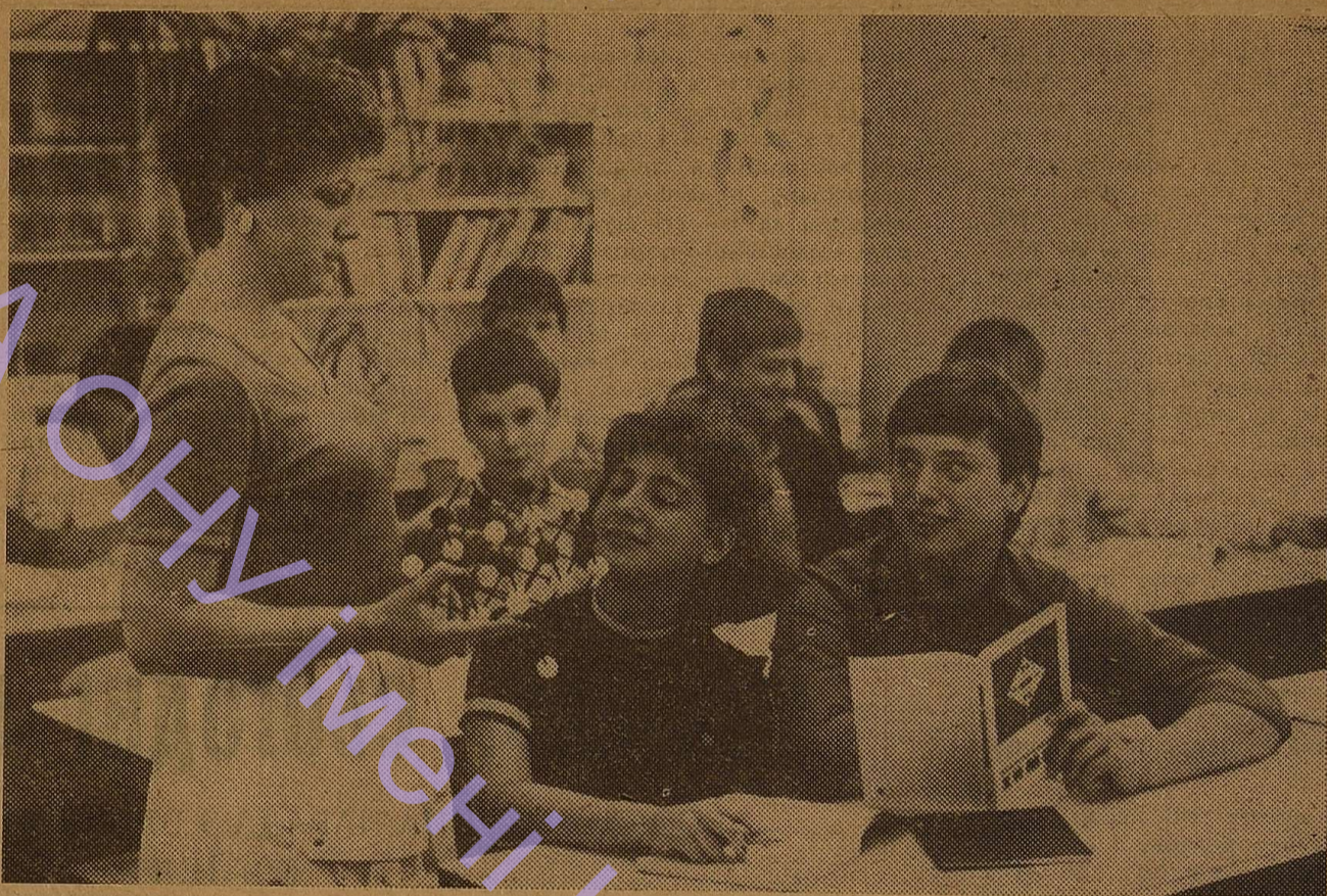
У студентів V курсу — гарячий час. В розпалі педагогічна практика. Майбутні викладачі фізики, історії, біології, географії закріплюють набуті знання в школах міста.