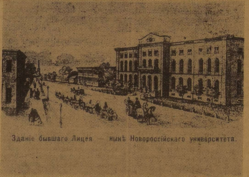
Головний корпус Рішельєвського лицейо. Збудований в 1852—1857 рр. за проєктом архітектора О. ШАШИНА.

О. ГУБАРЬ, інженер кафедри фізичної географії.