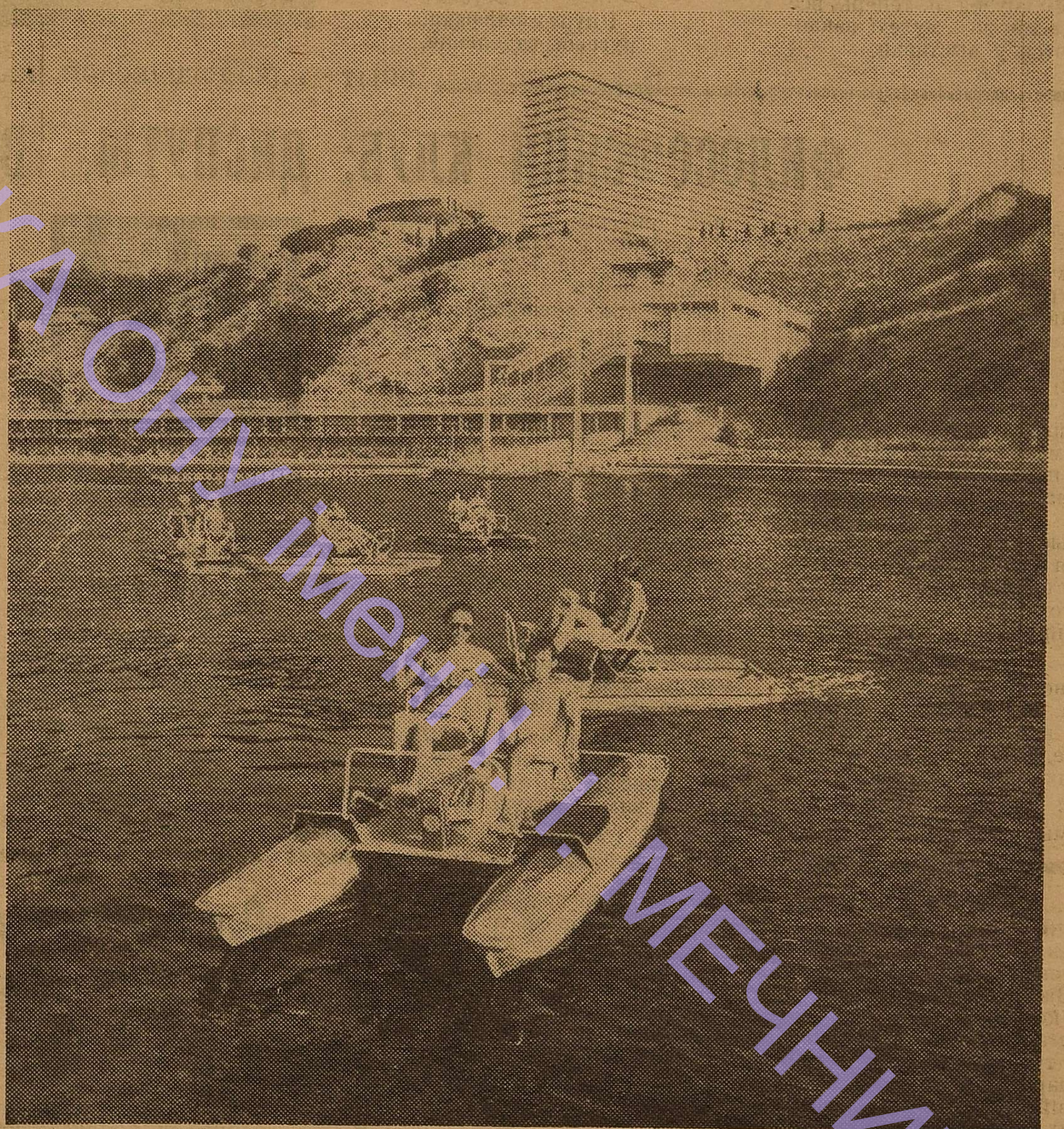
Ялта — город-здравица на Черноморском побережье. Его санатории, пансионаты, Дома отдыха летом принимают десятки тысяч студентов.