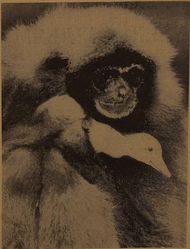
Гібон Сузі і качення, що народилося в зоопарку західнонімецького міста Клеєброн — нерозлучні друзі.

Новоявлена мати ніжно піклується про маля.