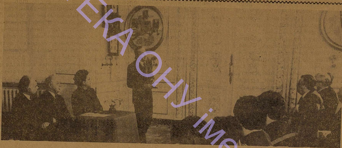
НА ЗНІМКУ: вечір в літературному музеї, присвячений Т. Г. Шевченку. Головує на вечорі лауреат Державної премії УРСР ім. Т. Г. Шевченка,

(За проєкту ЦК КПРС «Основні напрями перестройки вищої і середньої спеціальної освіти в країні»).