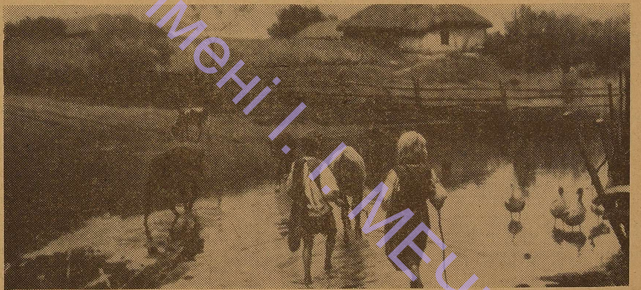
На знімку: репродукція картини М. Пилеоненка «Брід».