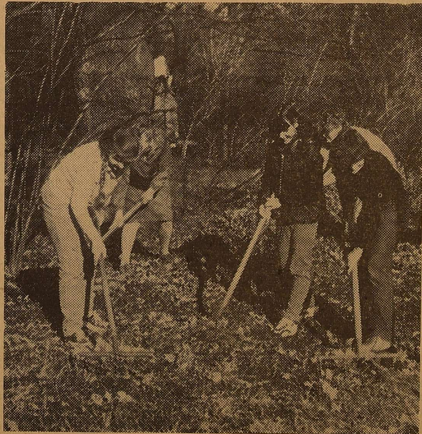
На суботнику в Ботанічному саду.

4—5 квітня відбудуться секційні заняття з різних проблем університетської науки.