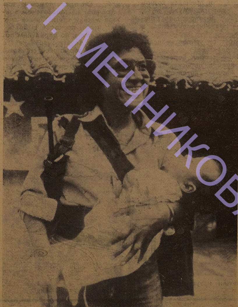
Визвольний рух проти проаміканської диктатури Дуарте у Сальвадорі набирав все більшого розмаху. В партизанські загоны йдуть і молоді жінки-матері. Вони мріють про щастя своїх дітей. Вони завоюють його зі зброєю в руках. НА ЗНИМКУ: партизанська мати.