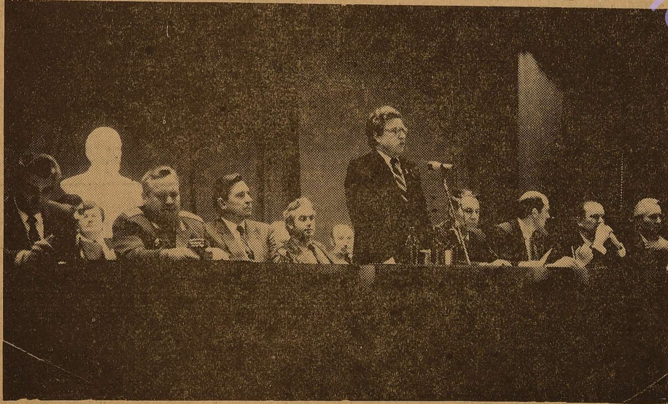
На знімку: в президії науково-практичної конференції «Програма комуністичного творення і миру».

На заключення учасники науково-практичної конференції одностайно прийняли рекомендації, що спрямовані на покращання і активізацію роботи кафедр суспільних наук і суспільствознавців міста. В рекомендаціях, зокрема, вказується на необхідність більш повного використання наукового потенціалу кафедр суспільних наук і підвищення ефективності наукових досліджень.