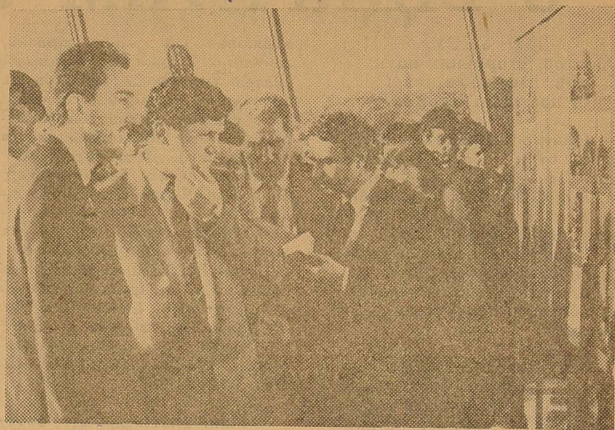
Італійські представники разом з одеськими друзями оглядають виставку фотографій з життя міста-героя в фойє залу туркомплексу «Одеса».