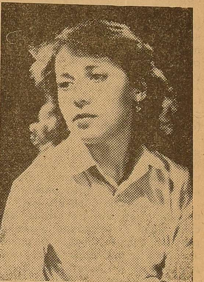
Л. Статі, історич. ф-т