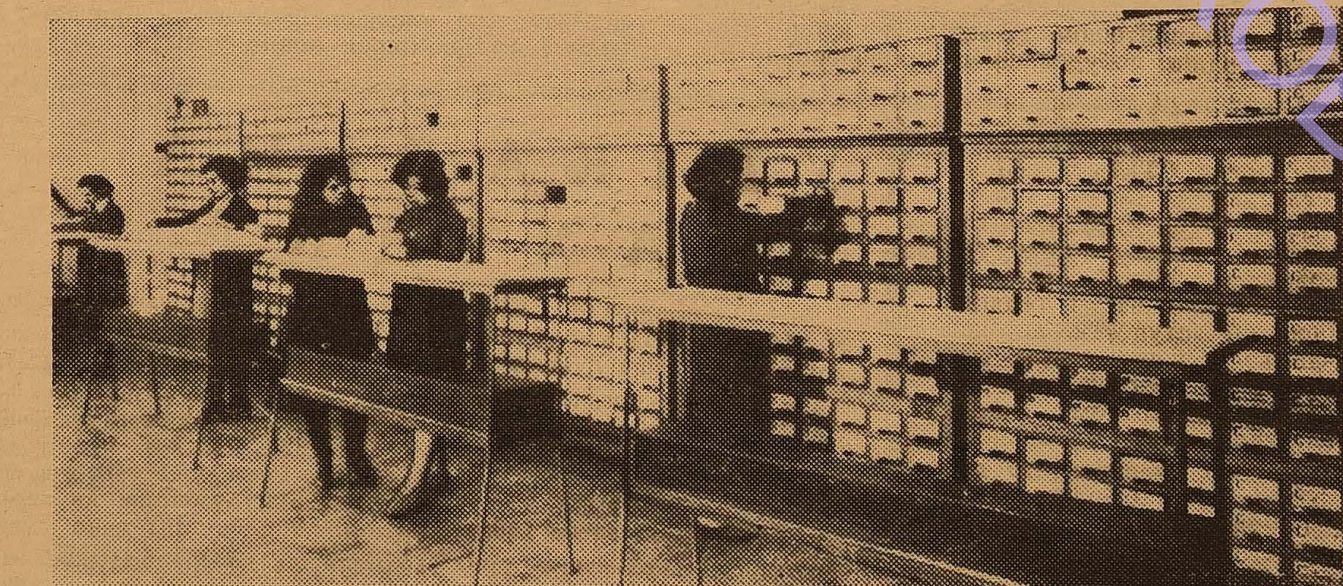
Незабаром зимова сесія. Але вже сьогодні читальні зали переповнені студентами, які готуються до екзаменів. На знімку: в каталожному залі наукової бібліотеки.