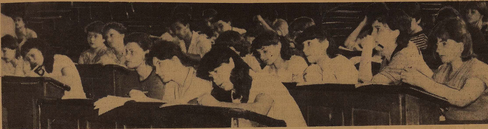
Идуть заняття у Великій хімічній аудиторії.