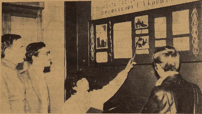
Біла стелу, присвячену вченому.