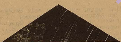
У палеонтологічному музеї.