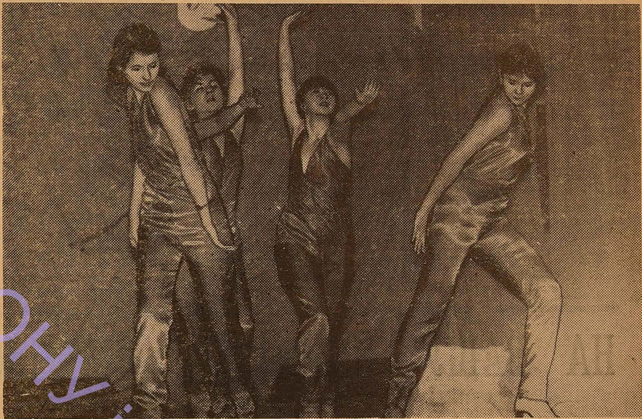
Уривок із диско-балету «Балада про космічних закоханих» у виконанні диско-групи «Пульсари» механіко-математичного факультету.