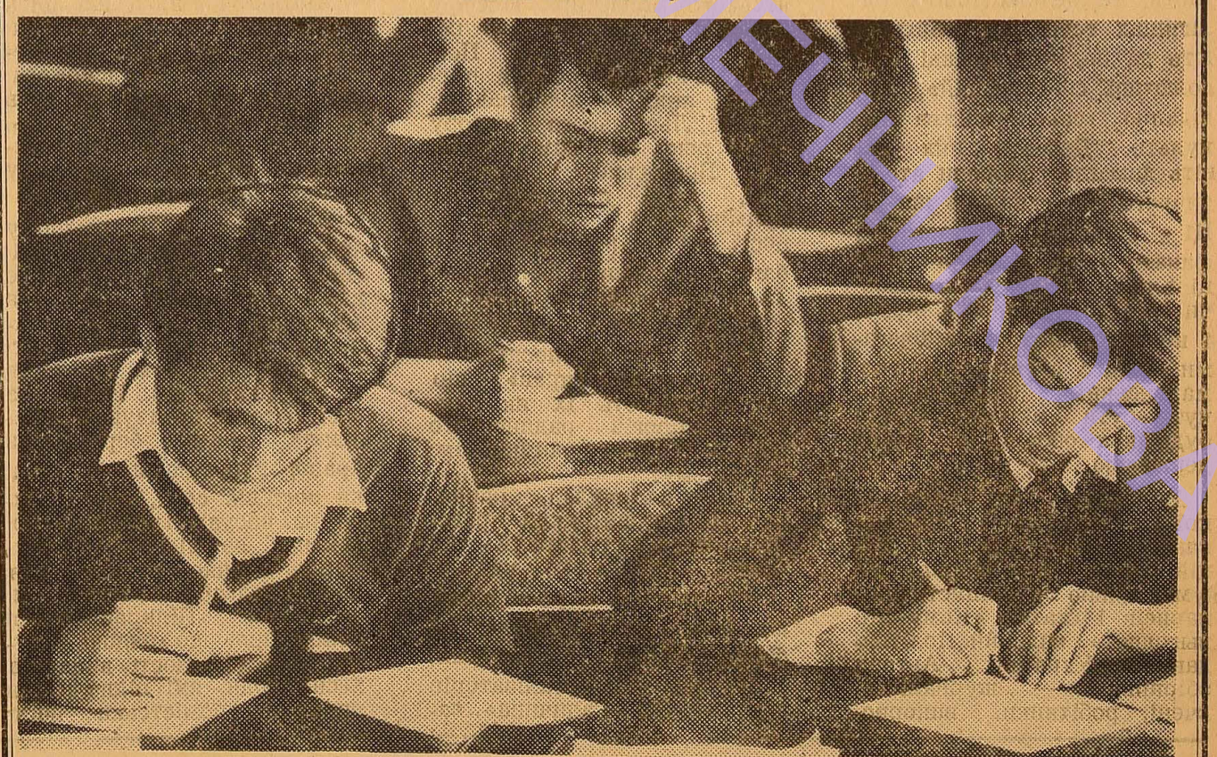
Наукова бібліотека. Тут готуються до лекції студенти різних факультетів університету. Але зараз тут багато п'ятикурсників — вони готуються до державного екзамену з наукового комунізму.