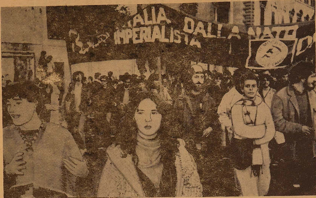
РИМ. Понад 150 тисяч італійців із різних областей та провінцій взяли участь в загальнонаціональному марші за мир, роззброєння і ліквідацію американських ядерних баз на території їх країни і в усій Західній Європі (на знімку).