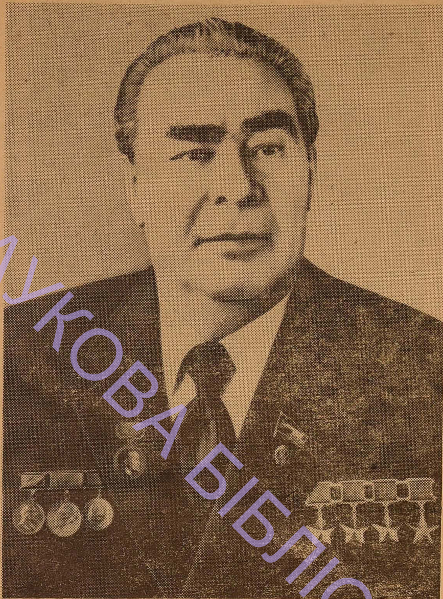
Видатний державний і політичний діяч, невтомний борець за мир, член Політбюро ЦК КПРС, Генеральний секретар ЦК КПРС, Голова Президії Верховної Ради СРСР, Голова Ради оборони СРСР, Маршал Радянського Союзу товариш Леонід Ілліч БРЕЖНЄВ.