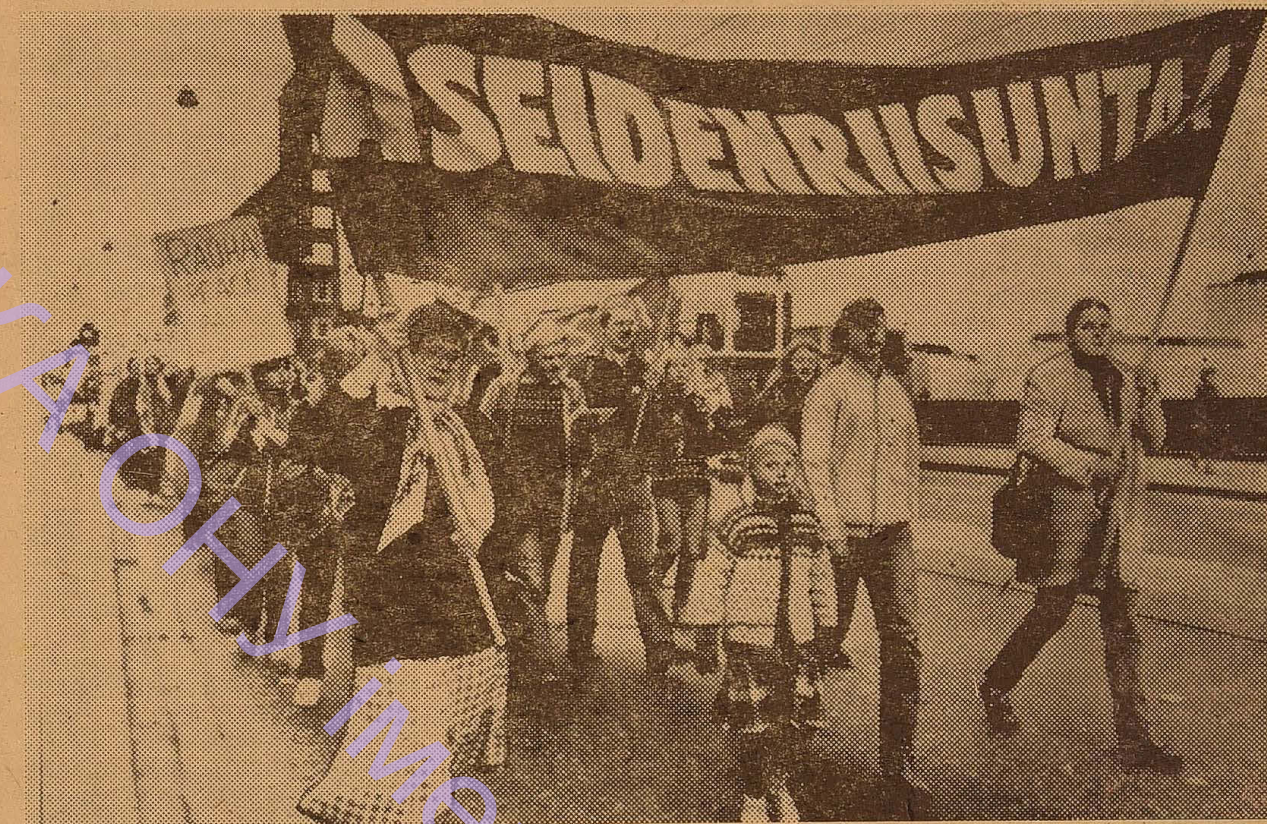
ФІНЛЯНДІЯ. Проти загрози війни, за послаблення міжнародного напруження, за мир та роззброєння виступили учасники демонстрації, що відбулася в Хельсінкі. На знімку: учасники маніфестації з плакатами «За роззброєння!», «За мир!».