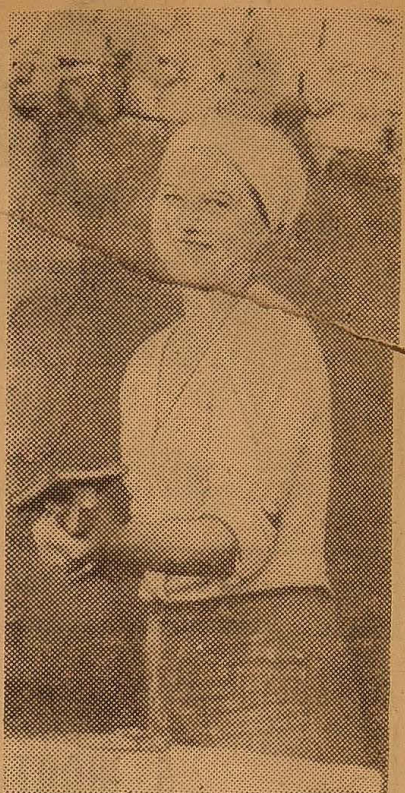
ється КВН, який ми провели зі студентами інституту народного господарства і перемогли.

А ввечері, після роботи, у вихідні дні проводились вечори відпочинку, дискотеки, дівчата у складі агітбригади виїжджали з лекціями і концертами до тваринників, виноградарів. Тепло зустріли будівельники концертну програму, присвячену Дню будівельника. Надовго запам'ята-