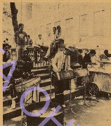
Вкрай важким залишається становище негритянської молоді США.

На знімку: для цього негритянського юнака — жите-