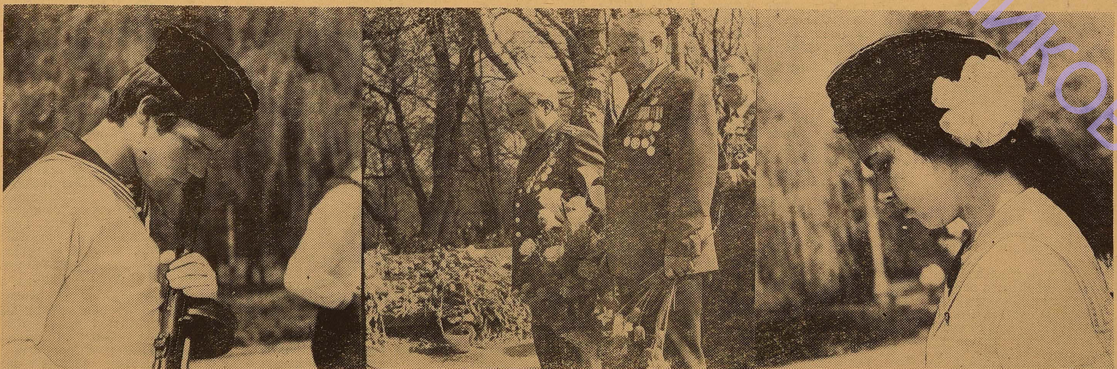
ОДЕСА. На алеї Слави. Ніхто не забутий, ніщо не забуте.

У нас є резерви, які ми використаємо з тим, щоб у всеозброєнні зустріти літню екзаменаційну сесію.