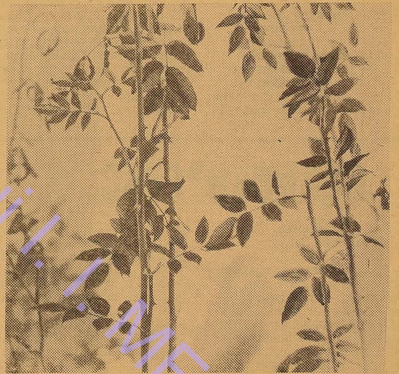
Весна на півдні.