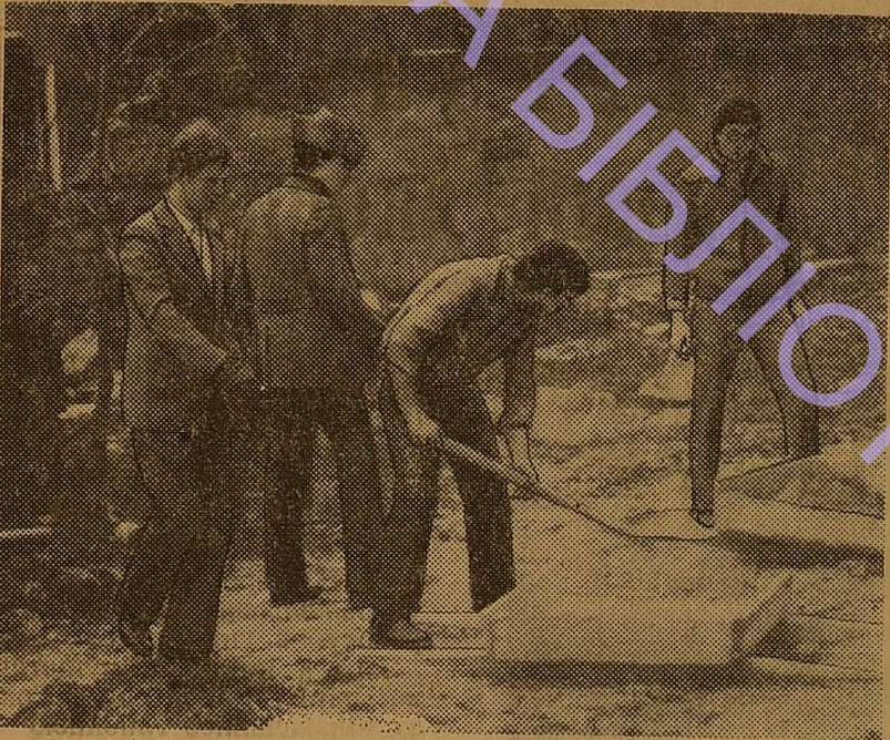
Студенти факультету РГФ активно включилися у виконання соціалістичних зобов'язань, прийнятих в честь XXVI з'їзду КПРС.

На знімку: студенти працюють на недільнику.