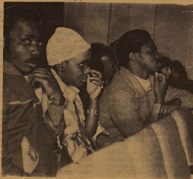
Они внимательно слушают лекцию.

Сегодня мы передаем эстафету студентам младших курсов и призываем их крепить интернациональную дружбу, неутомимо овладевать знаниями, выполняя завет гения человечества В. И. Ленина учиться, учиться и учиться!