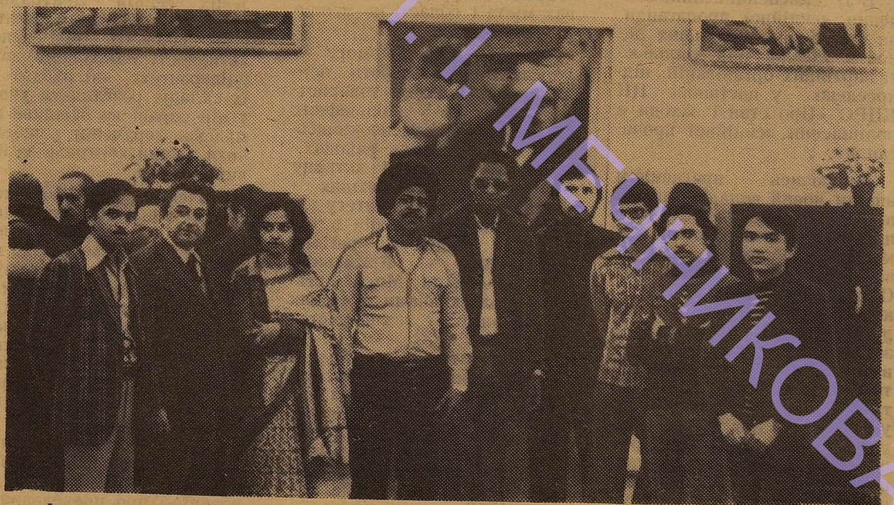
Фотография на память.

Вернувшись к себе на родину, я буду рассказывать о чудесной стране, в которой занимался 5 лет, — Советском Союзе, о его привлекательных людях, об их счастливой жизни и мирном труде.