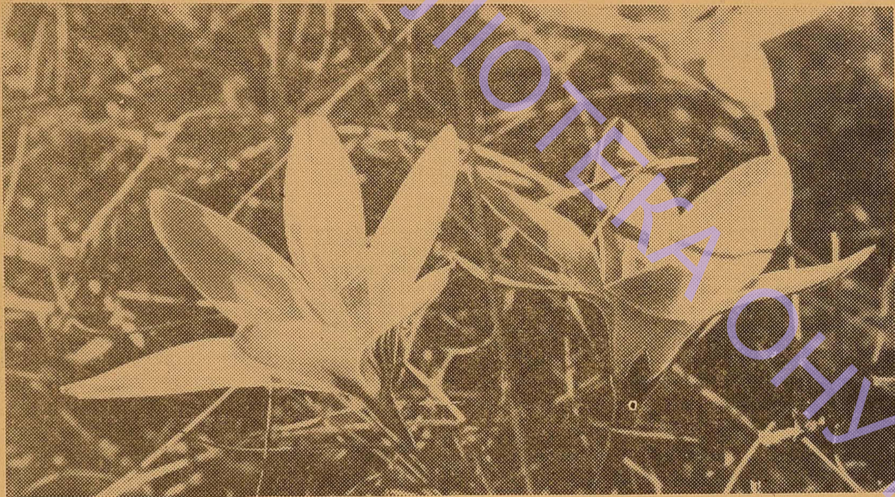
Весна на півдні.