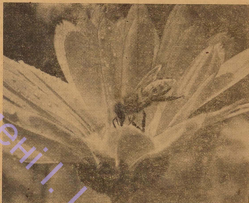
Фото Е. Кладіва. (V курс, фізфак).