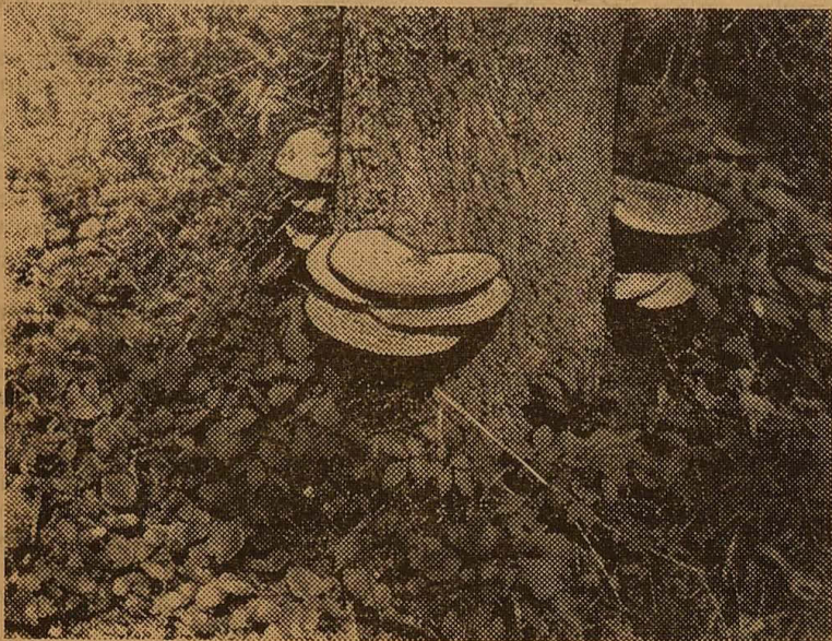
В кадрі куточок природи.

«За научные кадры», орган парткома, ректората, профкома и комитета комсомола Одесского государственного университета им. И. И. Мечникова. (На украинском языке).