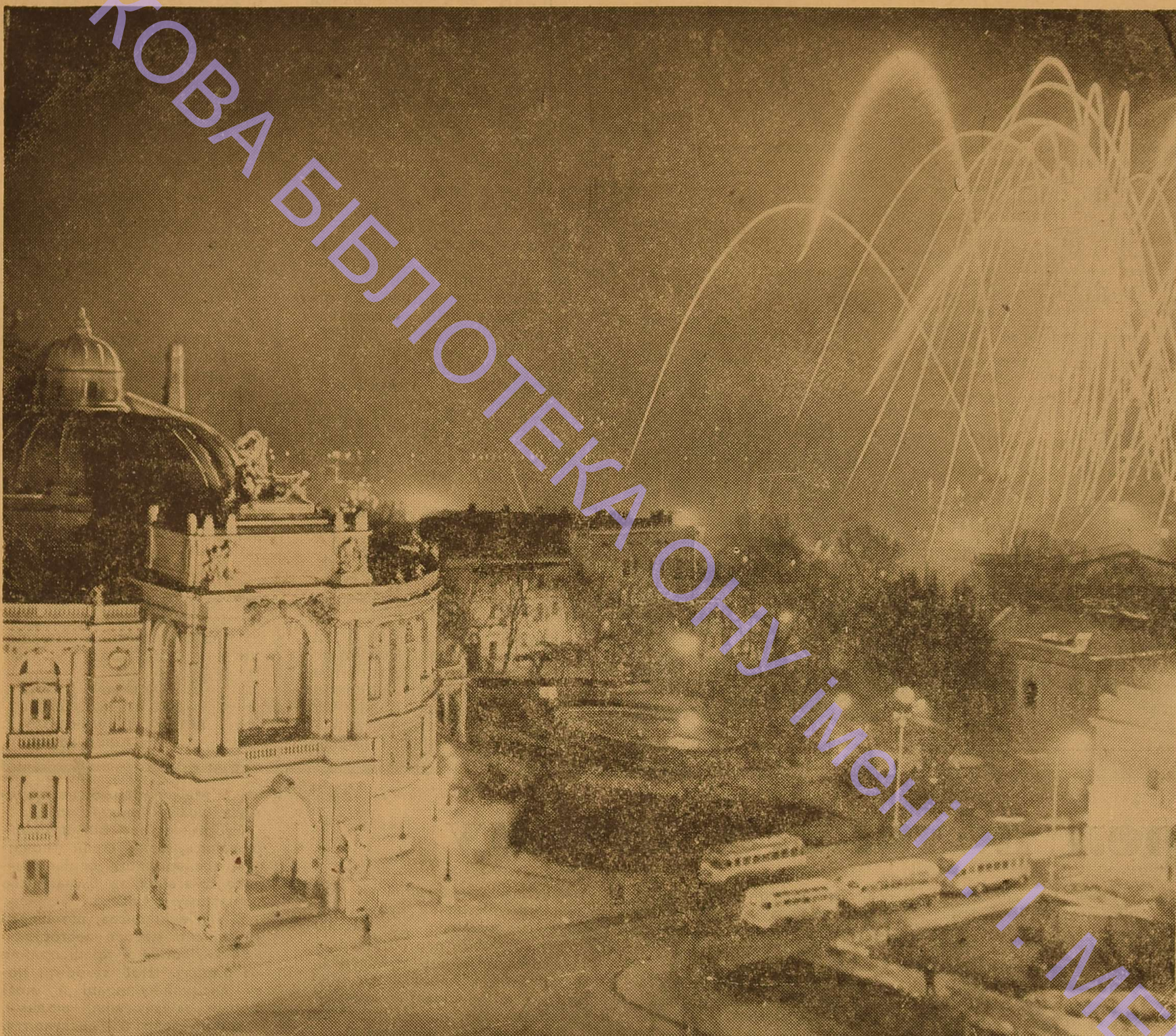
перетворили в добре укріпленний рубіж оборони.

РІК ВИДАННЯ 45-й № 12 (1346). 6 КВІТНЯ, 1979 р. Виходить щоп'ятниці. Ціна 2 коп.