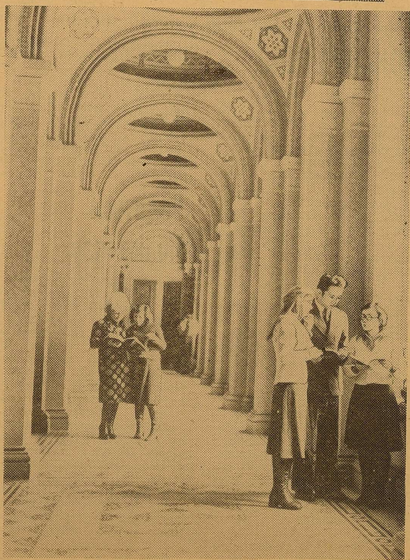
Фото І. СВЕРИДИ . (Фотохроніка РАТАУ).

На знімку: у вестибюлі головного корпусу.