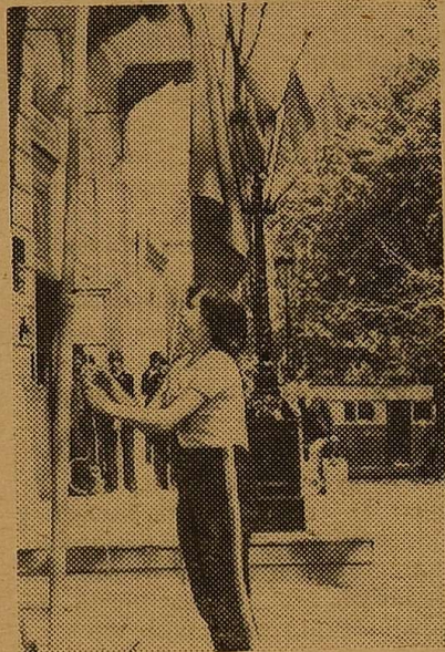
Прапор змагань піднято!

Уже повідомлялось, що 8 травня відбулась традиційна легкоатлетична естафета на приз газети «За наукові кадри».