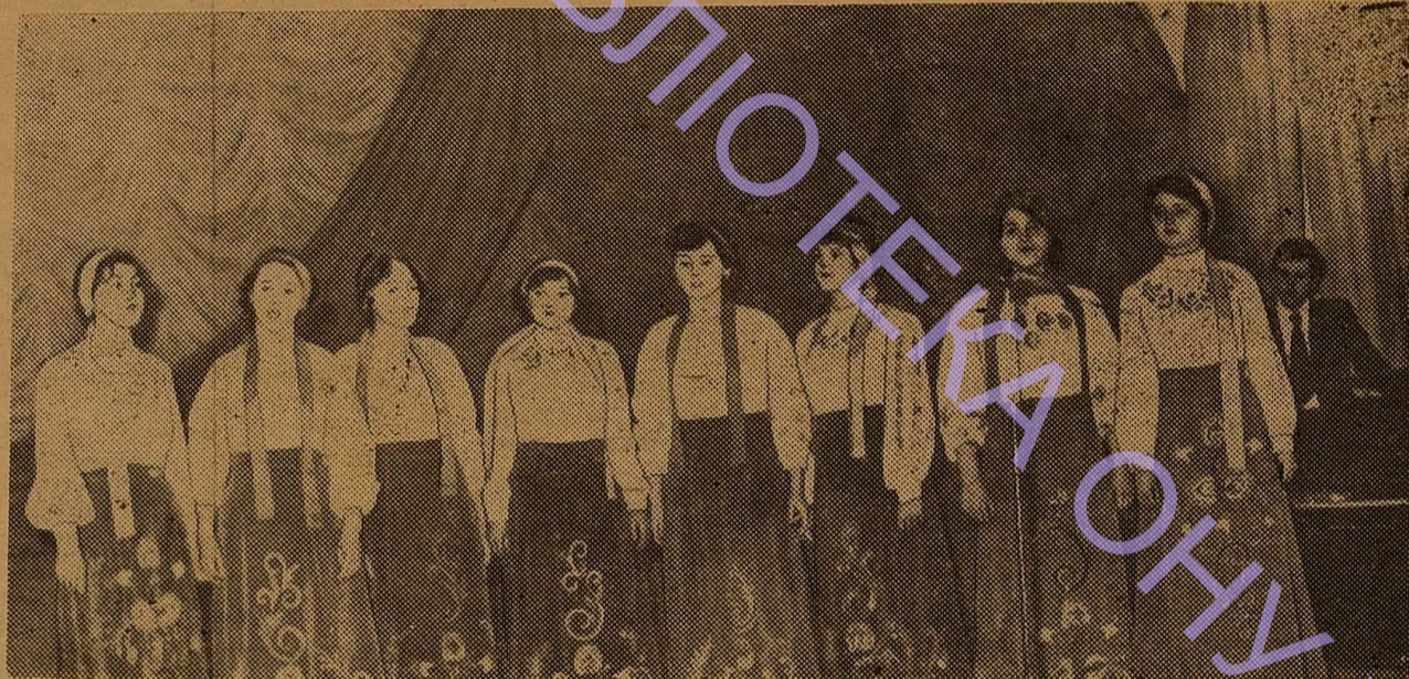
На знімку: вокальний ансамбль геолого-географічного факультету.

пов'язаний з основою людської поведінки — світоглядом, переконаннями і часто визначає їх. Дуже добре про це пише Леонід Ілліч Брежнев у своїх спогадах «Мала Земля»: