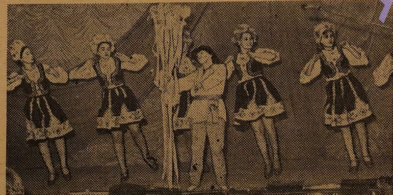
На знімку: танцювальний колектив геолого-географічного факультету виконує «Буковинську польку».

Цікаву програму запропонували на огляд студенти-хіміки. Високу оцінку отрима-