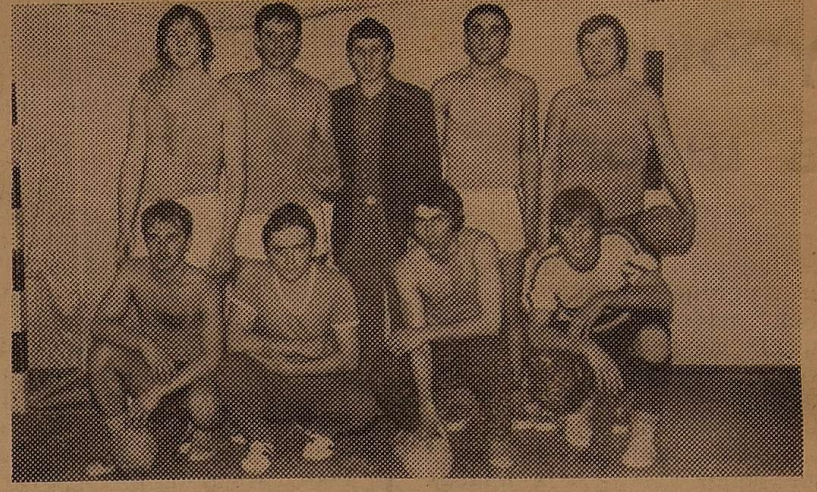
◆ Переможці першості університету з гандболу — хлопці геолого-географічного факультету після одного з матчів.

ДЗВОНІТЬ: телефони: міський 23-84-13, внутрішній 841 (з міста 206-841).