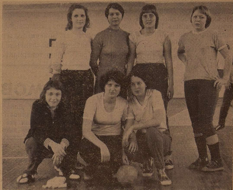
◆ Збірна команда дівчат філологічного факультету посіла друге місце в першості університету з гандболу.