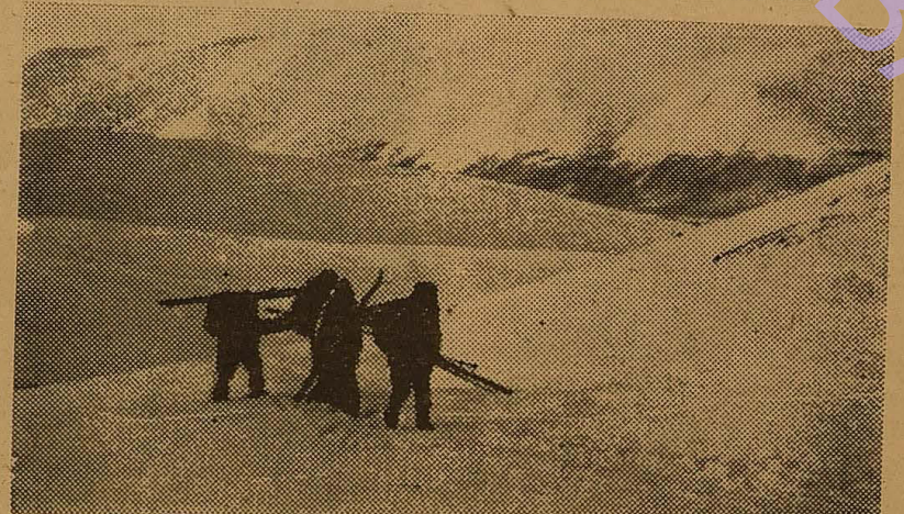
На фото: У Хібінах