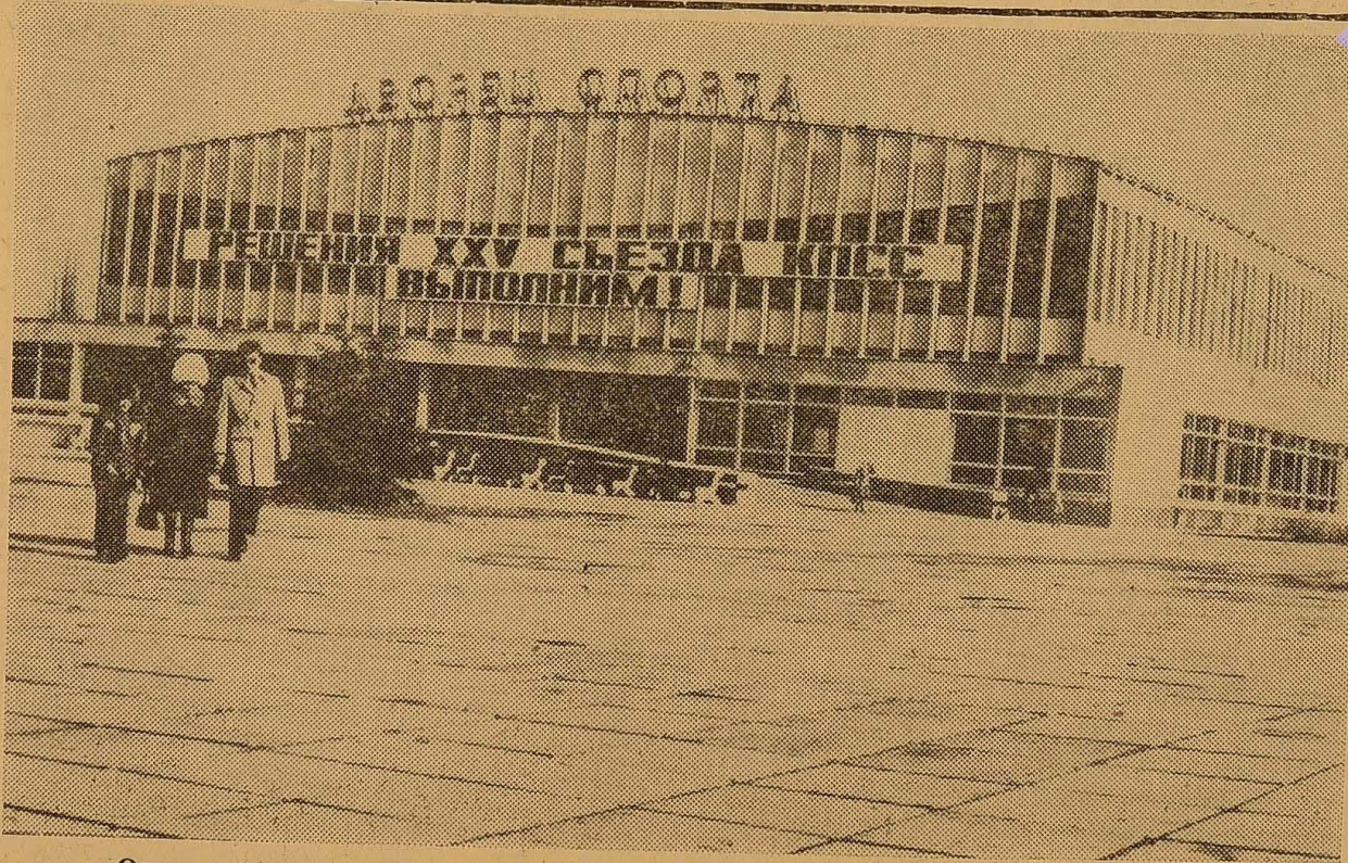
Одеський палац спорту — одна з кращих спортивних споруд нашого міста.

«За научные кадры», орган парткома, ректората, профкома и комитета комсомола Одесского государственного университета и им. И. И. Мечникова. (На украинском языке).