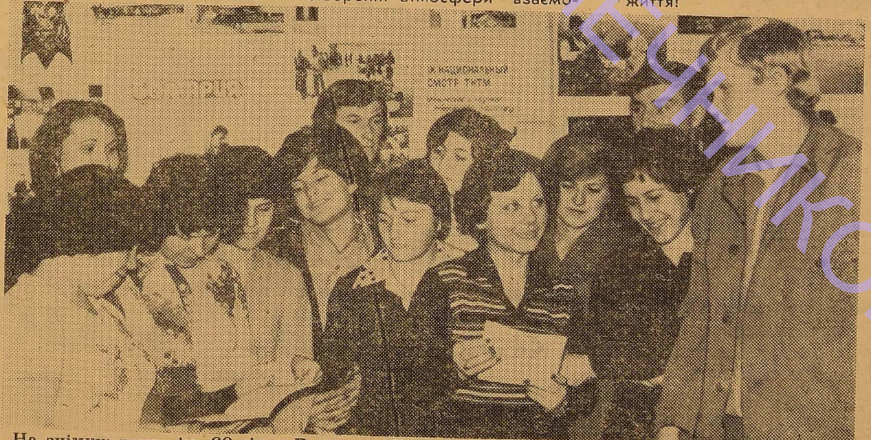
На знімку: група ім. 60-річчя Великого Жовтня (фізгеографи V курсу геолого-географічного факультету).

Від імені читачів ми вітаємо переможців Ленінського огляду академгруп, бажаємо успіхів у навчанні, громадській роботі, і, як п'ятикурсникам, — щасливого старту у велике життя!