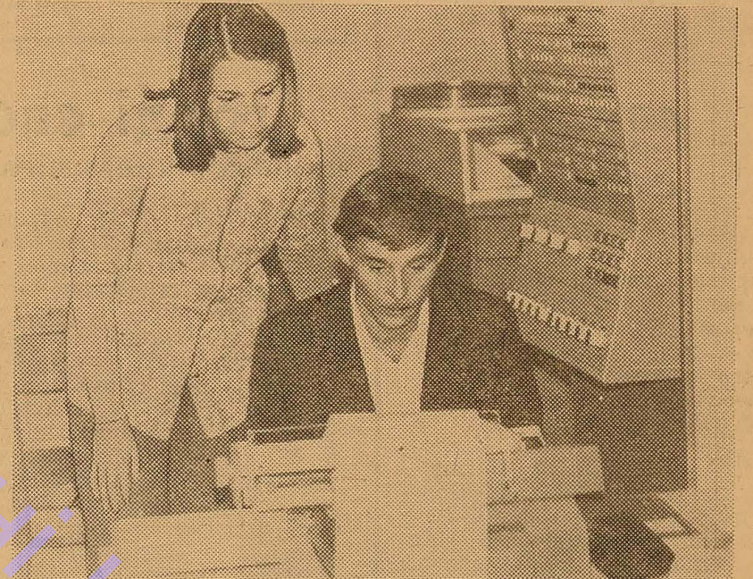
● На обчислювальному центрі ОДУ.

(«Радянський студент», Чернівецький державний університет).